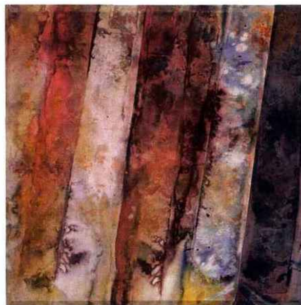
Sam Gilliam, Repeat , 1971, acrylique sur toile, 182,9 x 182,6 x 7,6 cm. David Kordansky Gallery, Los Angeles.