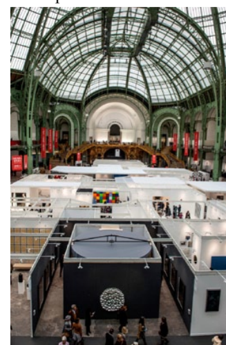
Vue de la FIAC 2014.