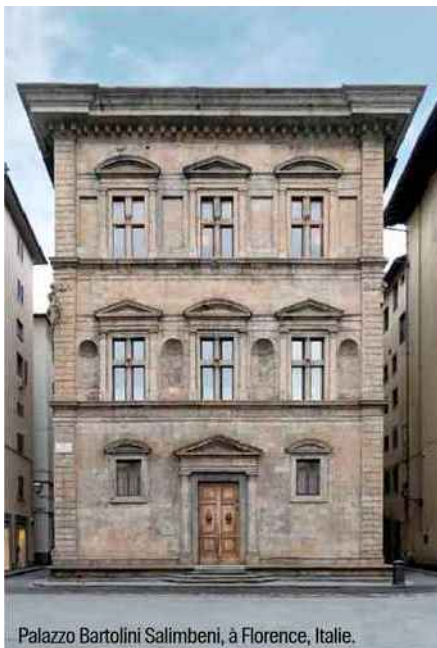
Palazzo Bartolini Salimbeni, à Florence, Italie.